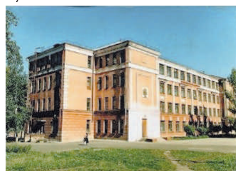
Новое здание школы

В течение трех лет 13 обучающихся получили аттестат об основном общем образовании с отличием, 10 обучающихся награждены медалью «За особые успехи в учении».