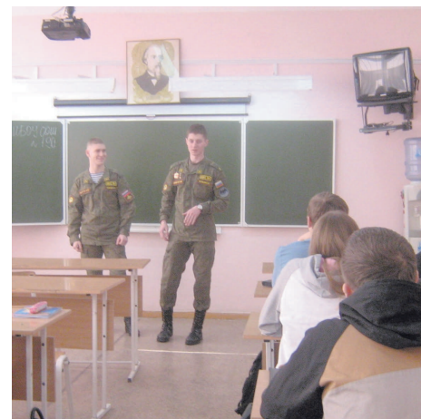
Урок мужества в 10 классе. 2016 г.