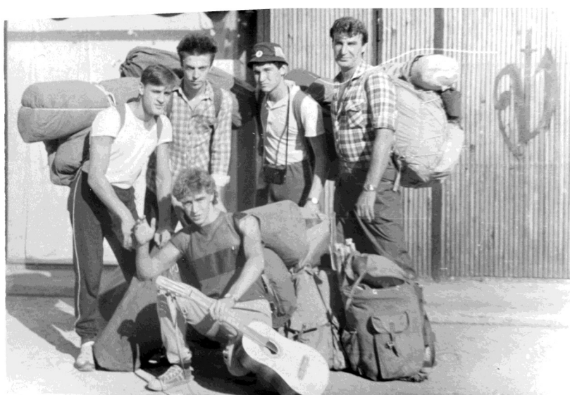
Перед сплавом в Горной Шории.