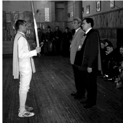
На турнире в честь Дня Победы.