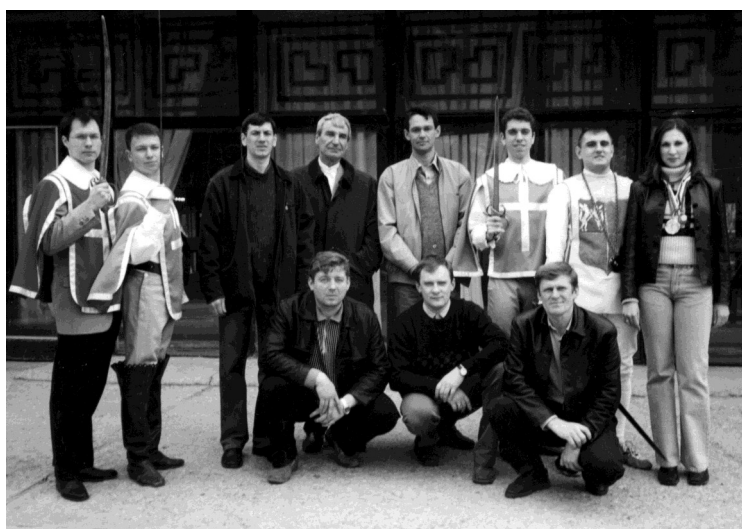
Выпускники клуба «Виктория».