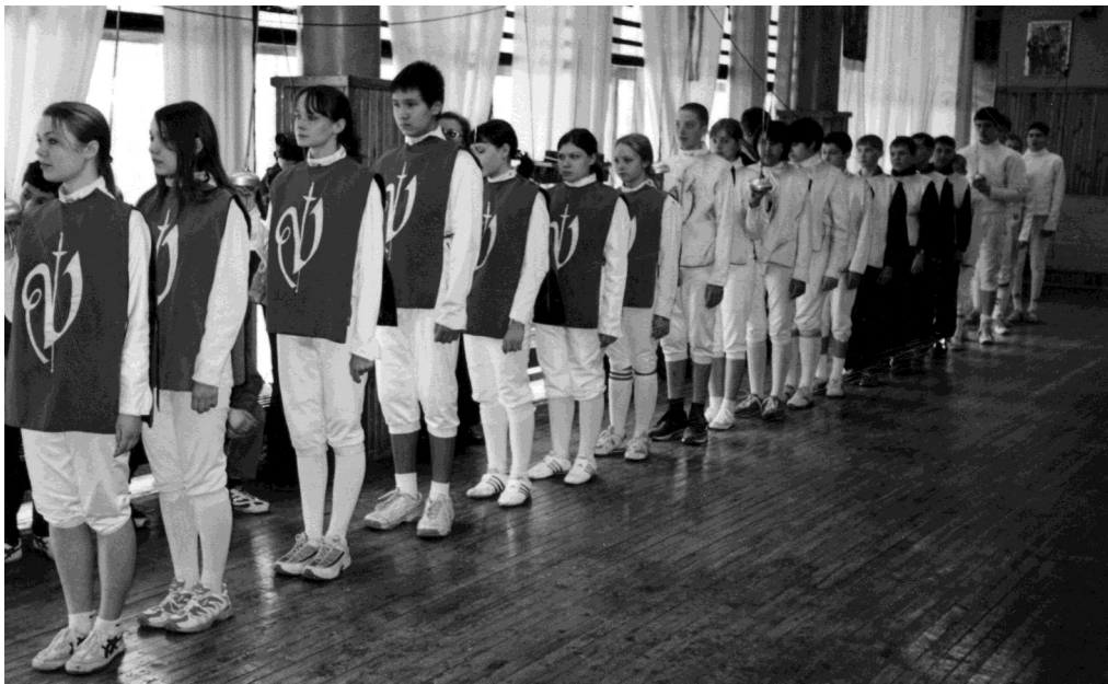
Парад участников соревнования.