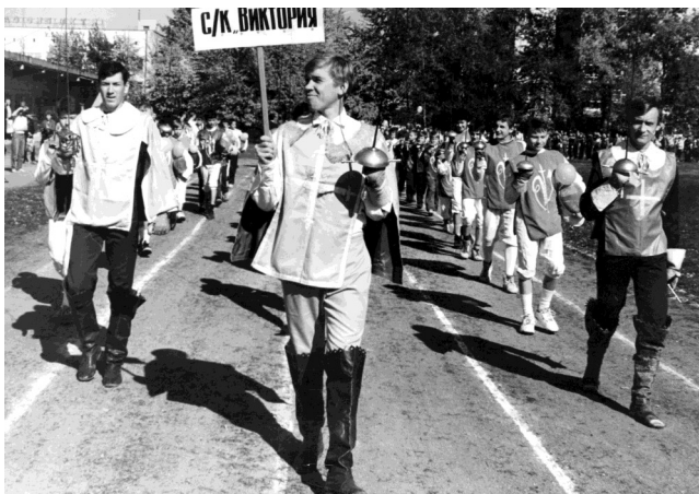
«Виктория» на параде.