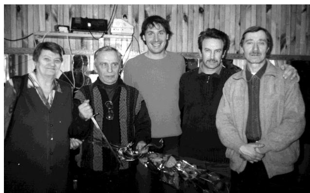
На турнире имени П. Кондратенко.