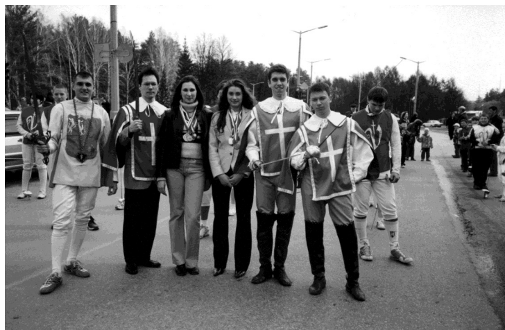
Викторианцы—призеры Первенств мира (1998—2006 г. г.).